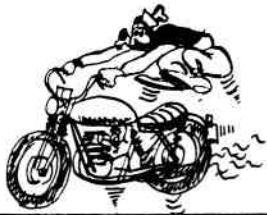
Fra mesterskaberne i klubfræs