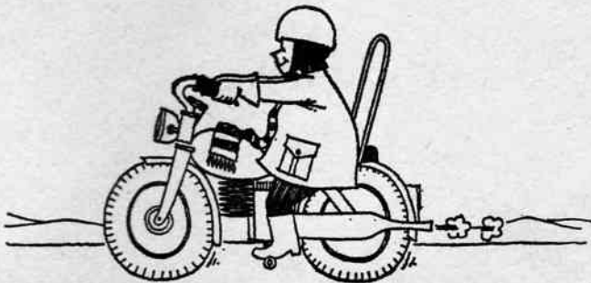
Årstidernes skifter, mærkes ikke på ryggen af en MC'er, hvor fornuft er lig med polarudstyr