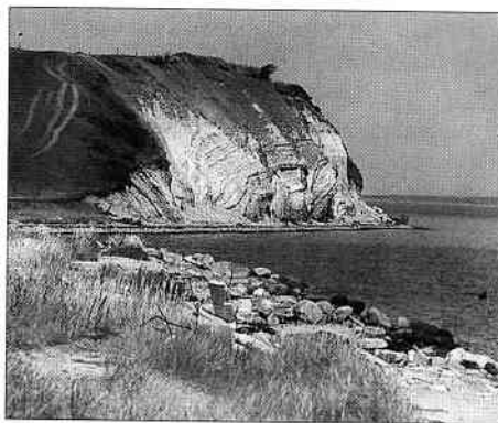
Feggesund (25 m).

Videre gik det ad 181 gennem Søndervig, Vedersø Klit til Torsminde, hvor jeg ca. to kilometer før byen, satte mig i klitterne og spiste min madpakke og frikadeller! - klokken var efterhånden blevet 12.00 - solen skinnede fra en skyfri himmel og duften af lyng og friskslået hø samt havluft gjorde den halve times hvil til en oplevelse af de store. Lemvig var den næste by, og her kunne jeg mærke den friske brise fra vesterhavet svinde og blive erstattet af en hed indlandsvarme. Turen fra Lemvig til Humlum ad 565 var rigtig flot. Ved Nissum by er du oppe i 61 meter over havet med udsigt over Oddesund. Nordpå gik det ad A11 mod Thisted, også denne strækning var præget af overvældelse over den danske natur. Inden Thisted drejede jeg af mod Mors. Fra Vilsund Vest fulgte jeg Margurit Ruten forbi Hanklit (60 m) - fedt mand! - så tog jeg færgen over Feggesund. Feggeklit er ca. 25 m høj og det var et