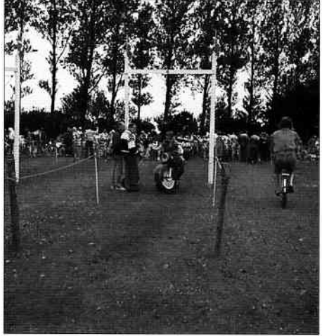
Ringryderpladsen i "Braue".

Flere tilskuere prøvede motorcyklerne, både i optog og på pladsen, og senere på hjemturen i de sene timer, - ja, for det var uden kørekort - tanken var fuld (og promillen blev ikke målt den aften).