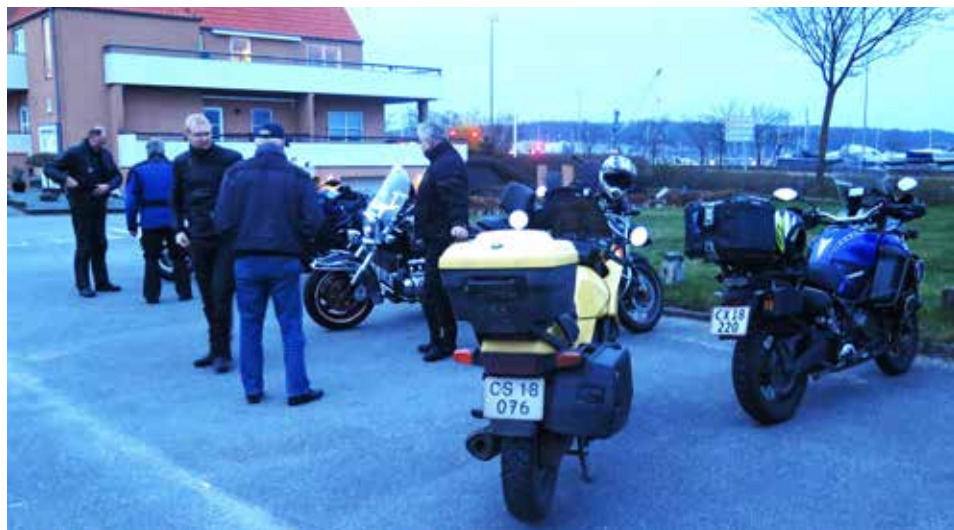
Kørsel fra stranden i Åbenrå onsdag d. 27. marts. Det var allerede mørkt.